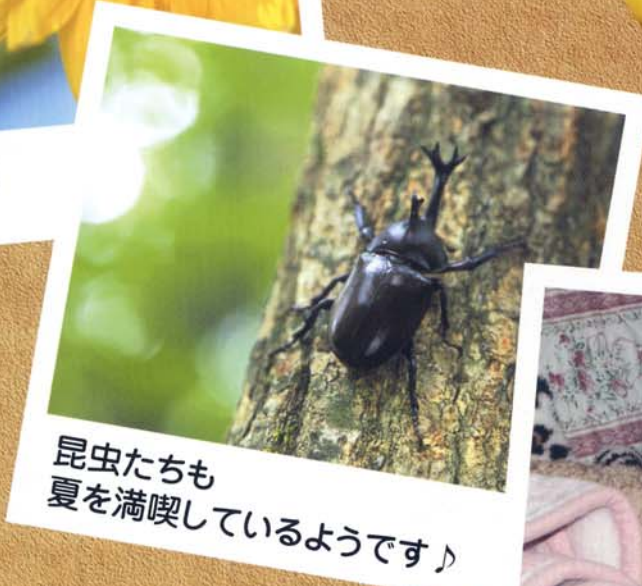
昆虫たちも 夏を満喫しているようです♪