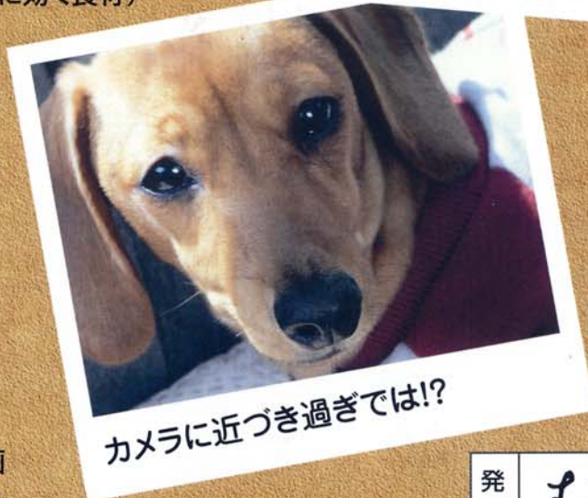
カメラに近づき過ぎでは!?