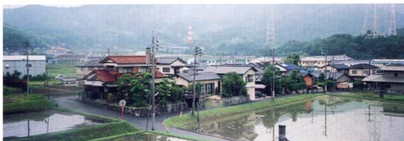
▲高架橋より山家地区ののどかな風景を望む