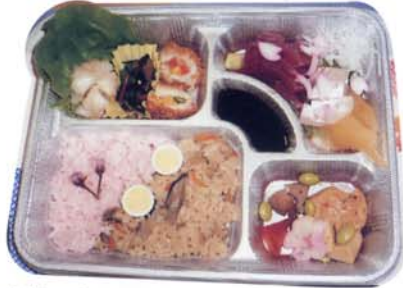
みんなで食べた花見弁当です♪

先日、新年度最初のイベントである苑内花見が行われました。今年もたくさんの花が集まりました。桜はもちろんチューリップ、菜の花、右を見ても左を見ても花ばかりの会になりました。外に出る機会の少ない入居者の方々に春の雰囲気を感じていただけたのではないのでしょうか。