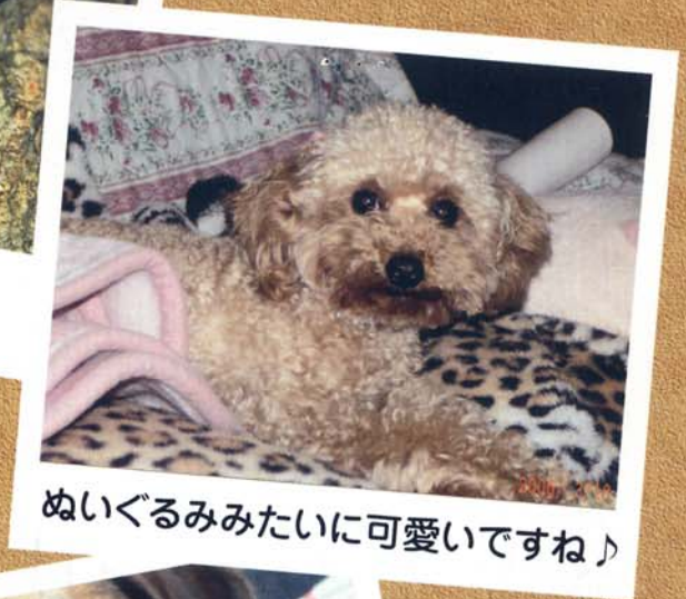
ぬいぐるみみたいに可愛いですね♪